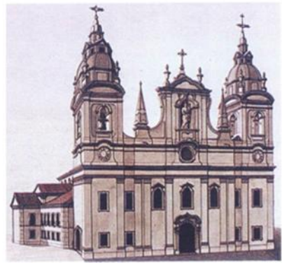
Aquarela de 1784 mostrando a fachada principal e parcialmente a fachada lateral direita. J.J. Godina

Disegno a colori della Cattedrale di Belém (PARÁ) , in acquarello, realizzato da Antonio Giuseppe Landi. Osservare l'immensa navata della chiesa in forma di croce latina con i suoi altari laterali.