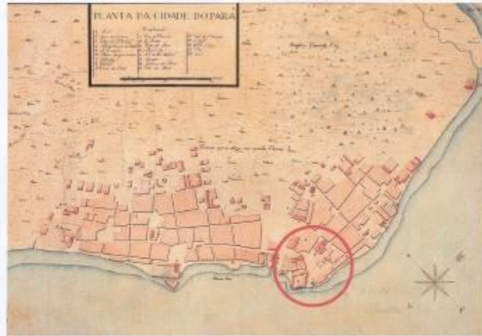
Ano 1780 Autor: Gaspar João Geraldo de Gromfeld