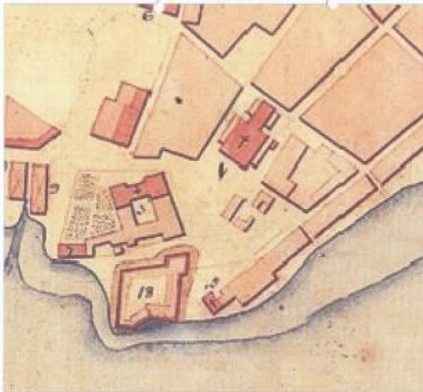
ANO - 1780 Autor: Gaspar João Geraldo de Gromfeld